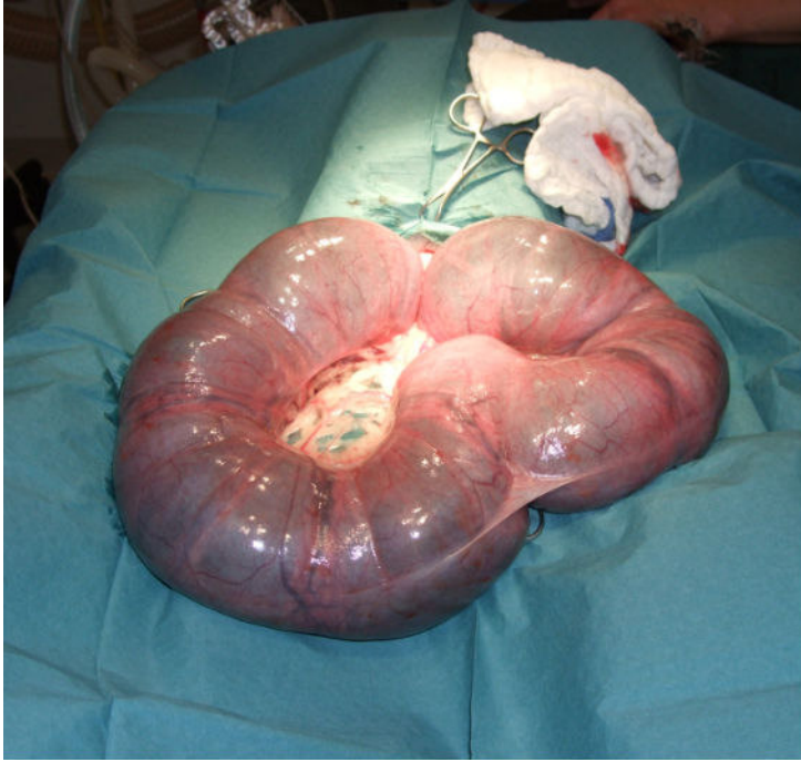
Alla ute men ännu ej framme....