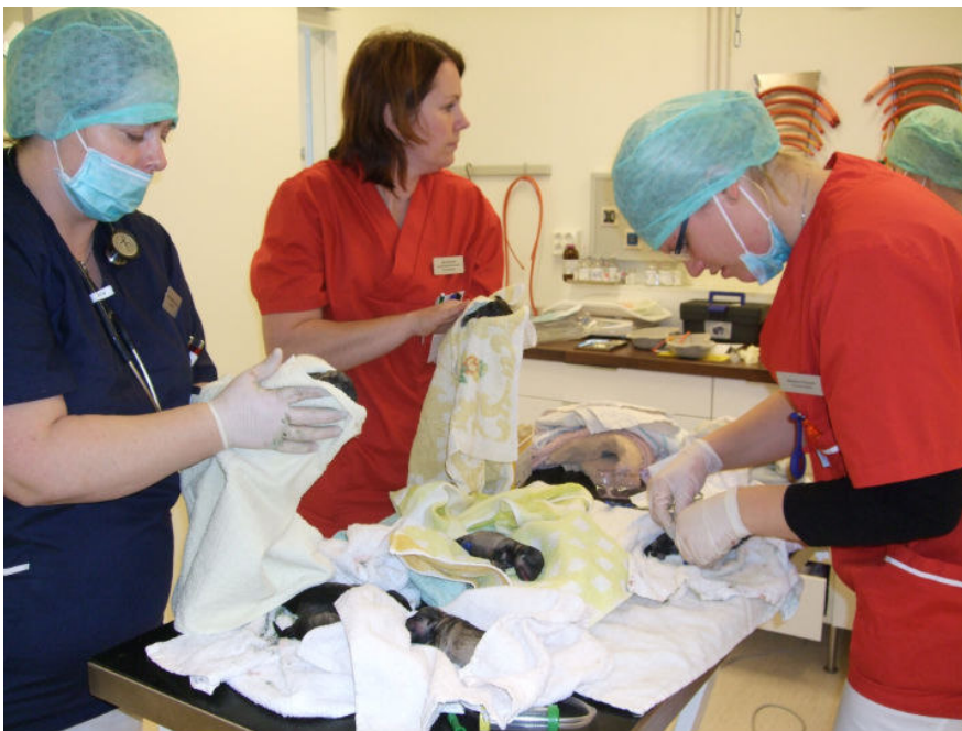
8 valpar, alla levande och ganska pigga. Full fart på hela styrkan