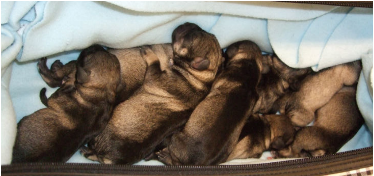
1 timme "gamla"